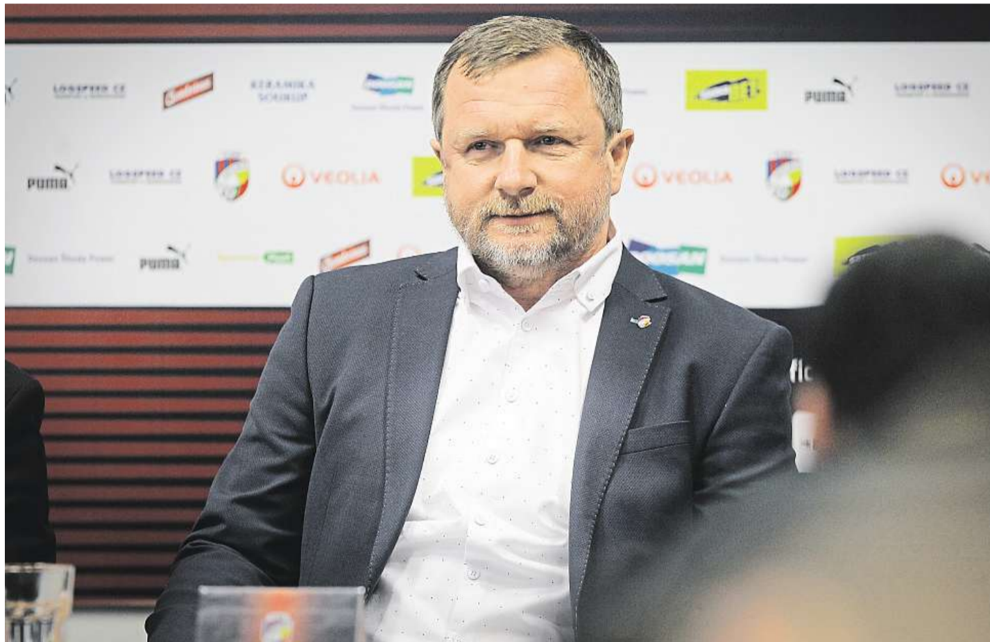
Staronový trenér Začátek letošního května. Pavel Vrba podepisuje s plzeňskou fotbalovou Viktorií novou smlouvu na tři roky.

Jsou to lidé, kteří si zaslouží respekt . Plzeňský kraj může být hrdý na úspěšné a schopné manažery, vynikající vědce i učitele, ale také na skromné hrdiny, kteří neváhali zachránit životy jiným.