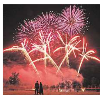
Silvestrovská kratochvíle Ohňová show může být nebezpečná pro zvířata na Šumavě.

Když novela zákona vznikala, její předkladatelé zákaz ohňostrojí v obcích uvnitř parků odůvodňovali mimo jiné šokem, jaký rachejtle a petardy způsobují divoce žijícím zvířatům v těchto oblastech. Impulsem k regulaci byly mimo jiné i